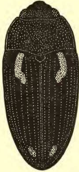
ABB. 3. Aulacochilus erythroperonus quadriplagiatus ssp. n. von Rhodesien: Kashitu.

2 Paratypen vom gleichen Fundort, iv. 1915.